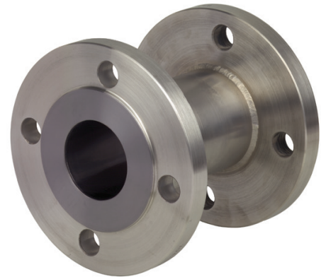
Трубные проточные мембранные разделители для фланцевых соединений, модель 981.27

Манометр или преобразователь приварены напрямую, преобразователь давления с резьбовым переходником