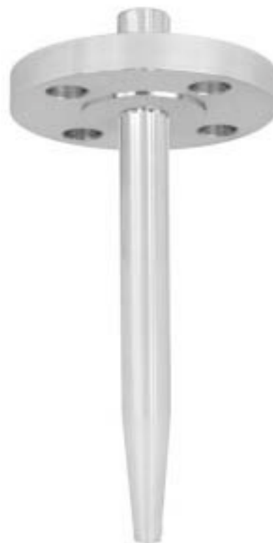
Защитная гильза с фланцем Модель SD400F