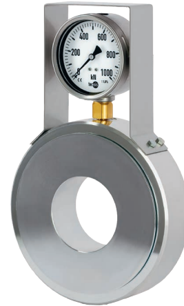
Hydraulischer Ringkraftaufnehmer, Typ F6171

Die Kraftmessung erfolgt nach dem hydraulischen Prinzip: Die auf einen Kolben wirkende Kraft führt zu einem Druckanstieg. Dieser wird nun entweder direkt durch ein angeschlossenes Anzeigegerät visualisiert oder mittels eines Drucksensors in ein analoges Signal umgewandelt.